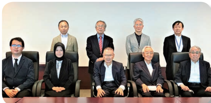
新奨学生が評議員会で挨拶 (2022.6)

New Scholarship students greet at Board of Councilors