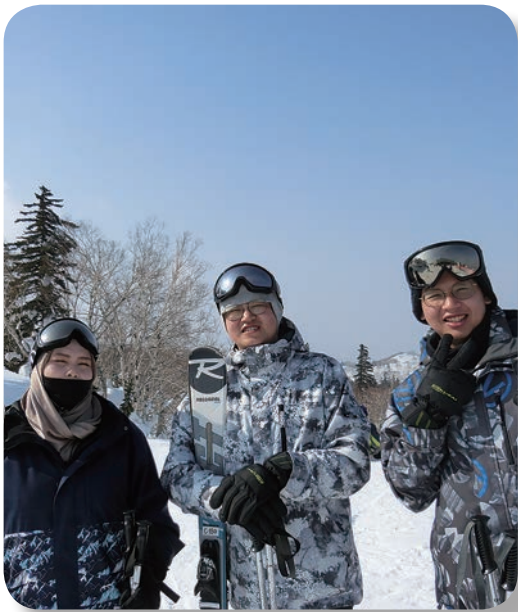
第30・31期生 北海道研修旅行 (2023.3)