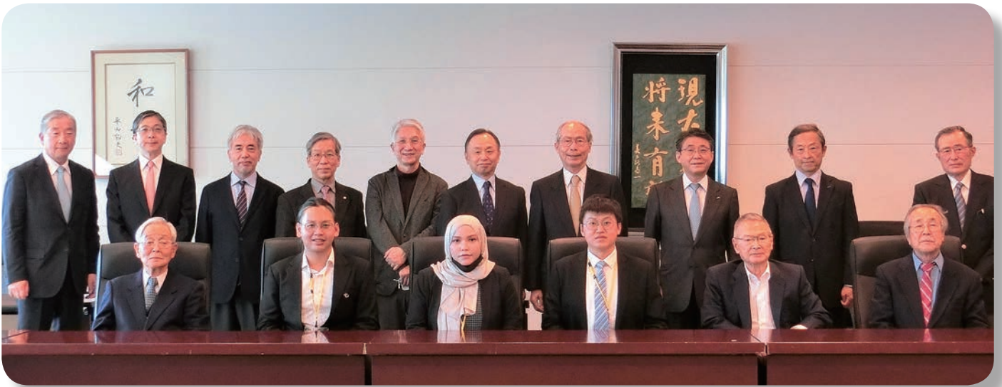
卒業奨学生が理事会・評議員会で挨拶 (2023.2)