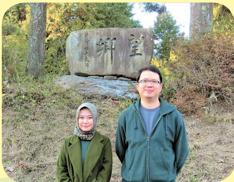
大和山「望郷」の碑の前で In front of the monument of Mt.OWA "Bokyo"