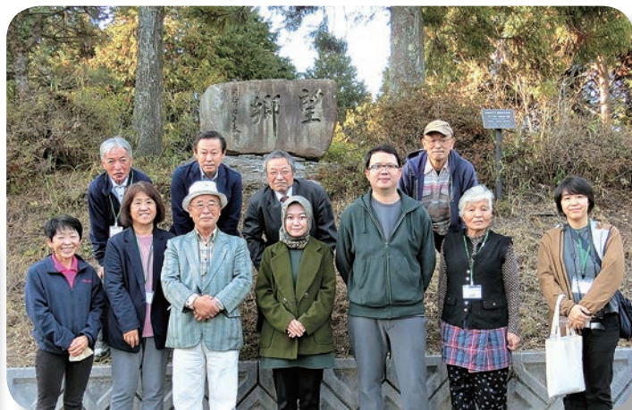
第32期生 岡山研修旅行 大和山「望郷の碑」の前で野山の会、岡崎嘉平太記念館の皆さんと (2022.11)

New Scholarship students greet at Board of Councilors