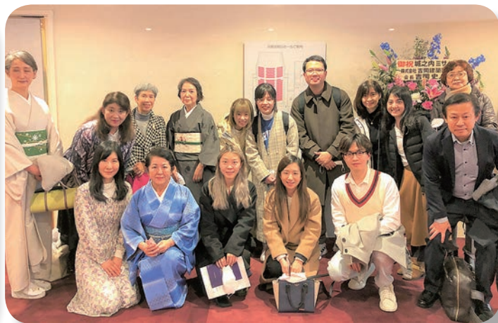
全日空白鷲会東京コンサート鑑賞会 (2022.12)

ANA Hakuro-kai Tokyo, Concert Appreciation