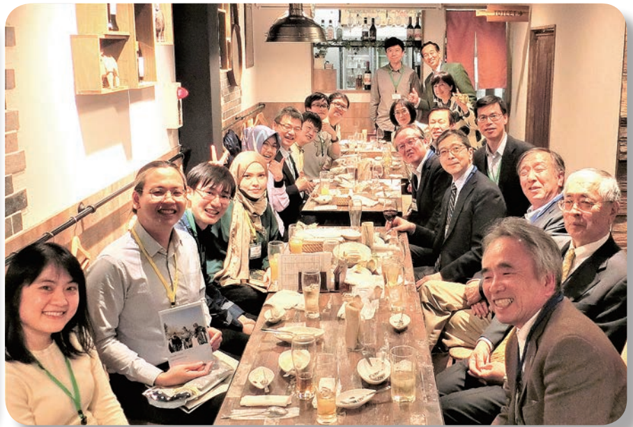
卒業奨学生送別会 (2022.3)